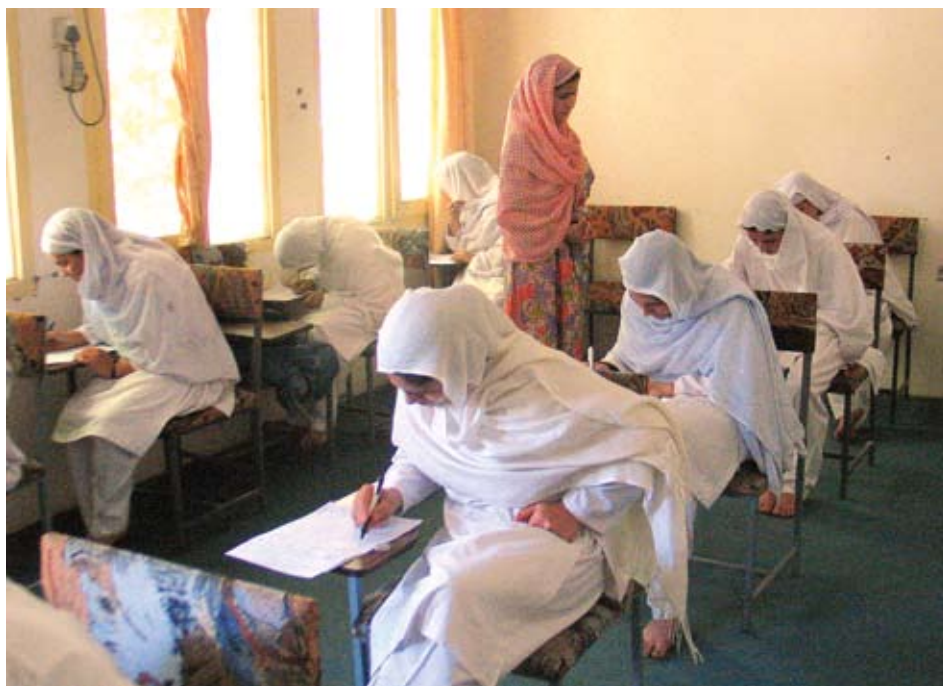
Førsteårstudentene sitter i dyp konsentrasjon. Mai måned er eksamenstid også i Afghanistan.

– Fortsatt er det jordmorutdanning i bare 19 av 34 provinser. Jeg var i Daikondi nylig hvor det for eksempel ikke er jordmorutdanning. Så det er langt fram. Men det begynner å merkes. I 2002 var det knapt 500 jordmødre og i 2007 var det 1990 utdannede jordmødre. I mange av landsbyene rundt Jalalabad er det jordmødre. Det fine med jordmødre er at de helst vil bo i landsbyen sin, sammen med familien. De vil ikke flytte, og dermed er hver utdannet jordmor en sikker investering i bedre helsestell for landsbygda. Med sine to års utdanning (eller 18 måneder) utgjør de en veldig god helsehjelp, understreker Holan nok en gang, og fortsetter: – Med