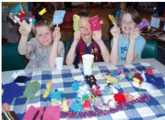
Totalt kr. 69.161 ble samlet inn.