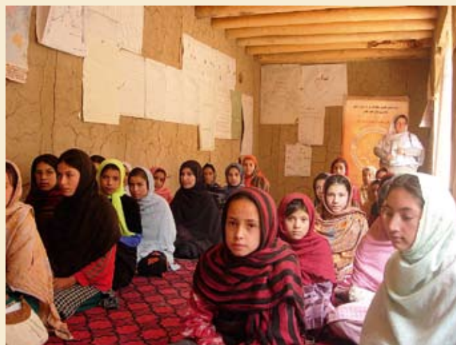
Fredsundervisning i Afghanistan: SDO gjev fredsundervisning for unge jenter i Farza.

Engasjementet vi opplevde hos kvinnene i Paghman då dei livleg diskuterte rettane dei har, var noko som gjekk igjen på dei fleste prosjekta vi besøkte. Dette vere seg hos jentene på sykurs i Kabul som stolt viste fram sin produksjon eller på alfabetiseringskurs hos ein storfamilie i Kalakhan der både bestemor på 70 og barnebarnet på 10 ivrig rekte opp handa for å svare på læraren sine spørsmål. Eit engasjement som inneheld både nysgjerrigskap og stor læringsvilje i