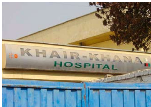
Operasjonssal på Khair-Khana sjukehuset.

Det gjorde et sterkt inntrykk å besøke dette sykehuset. Et stort sykehus som ligger