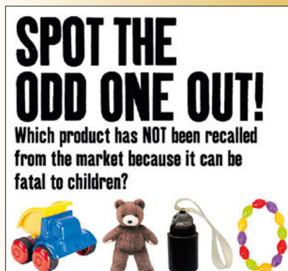
(Norsk folkehjelp) under plakaten "Spot the odd one out"

Fast bestemt på å sørge for at alle klasevåpen-ofre får oppfylt sine rettigheter og anerkjent sin verdighet.