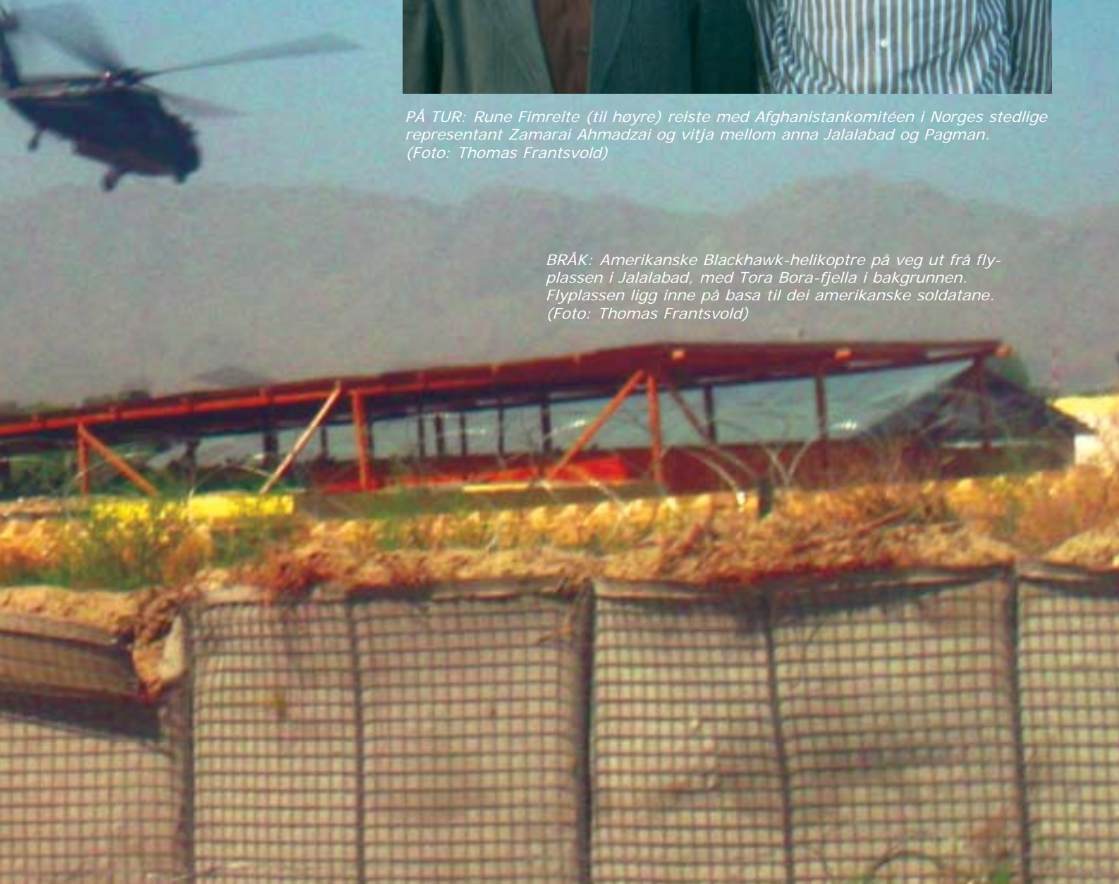
BRÅK: Amerikanske Blackhawk-helikoptre på veg ut frå flyplassen i Jalalabad, med Tora Bora-fjella i bakgrunnen. Flyplassen ligg inne på basa til dei amerikanske soldatane.