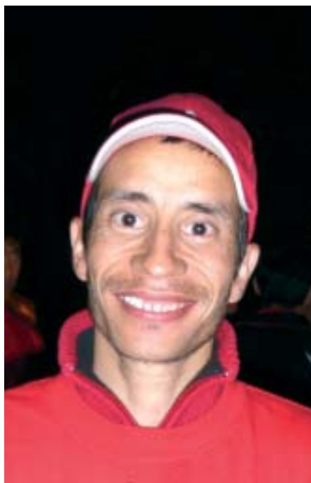
GLAD: De sultestrikkende afghanerne kan smile. Foreløpig.

Fordi de trenger beskyttelse rett og slett."