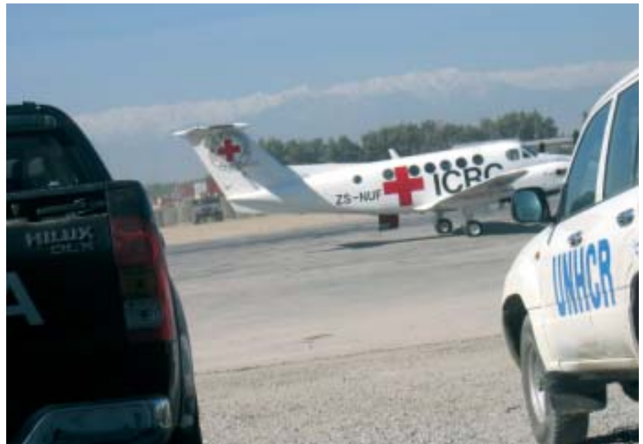
FLY: FN og hjelpeorganisasjonene flyr på den USA-kontrollerte flyplassen i Jalalabad, med Tora Bora-fjellene i bakgrunnen.

- For å si det kort: det som har gått galt har vært invasjonen av Irak. USA som har nektet å ta statsbygging i Afghanistan på alvor og heller startet en mislykket krig i Irak. For Afghanistan har resultatet vært for få vestlige tropestyrker, for lite penger, og fravær av en sammenhengende strategi og bærekraftige initiativ fra vestlige og afghanske ledere, skriver han.