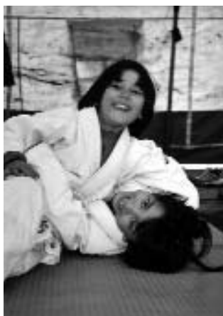
Judo for fred satser på at alle norske judoklubber skal bidra økonomisk til Aschianasentrene i Kabul.

Judo for fred er et fritt prosjekt under Norges Judoforbund og blir støttet av NORAD og Fredskorpset. Det går ut på utveksling av norske- og afghanske judoutøvere. Målet er å gi afghanske judointeresserte trening i judo og samtidig bidra til kunnskap om bedre hygiene, ernæring og ikke minst likestilling mellom kjønnene.