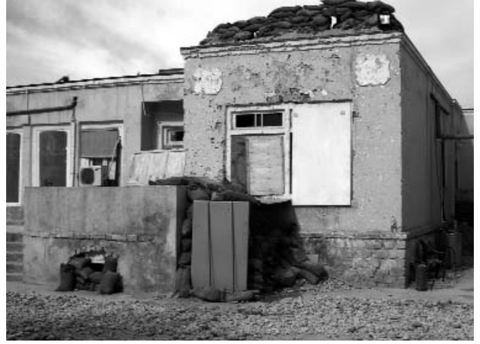
BESKUTT: Bygningene der de norske ISAF-soldatene søkte ly under beskytning i Maimana, Afghanistan, før og etter angrepet.